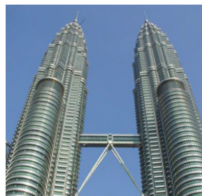
Das Wahrzeichen von Kuala Lumpur die 452 Meter hohen Petronas Towers.