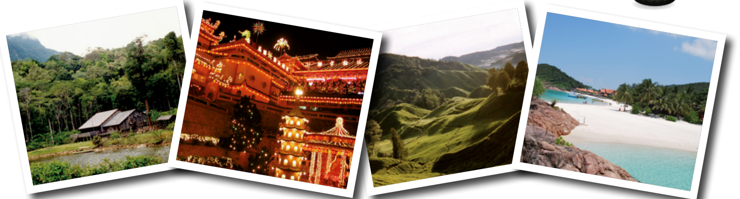
1) Borneo, nach Grönland und Neuguinea die drittgrößte Insel der Welt, ist aufgeteilt zwischen den drei Staaten Malaysia, Indonesien und Brunei. 2) Der Kek-Lok-Tempel ist einer der größten Tempel in ganz Südostasien und gilt als größter buddhistischer Tempel in Malaysia. 3) Die Cameron Highlands sind ein beliebtes Urlaubsziel und bekanntes Anbaugelände für Tee. 4) Malaysias Küsten sind über 4.800 Kilometer lang, vor ihnen liegen mehr als 200 Inseln mit vielen Traumstränden.