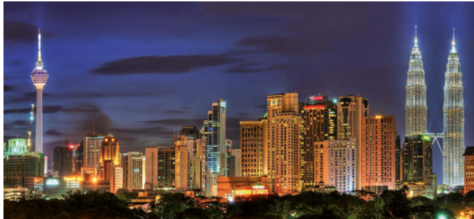
Die Hauptstadt Kuala Lumpur ist eine moderne Stadt – die meisten Bewohner nennen sie kurz „KL“.

Unabhängig vom „British Empire“ seit 1963